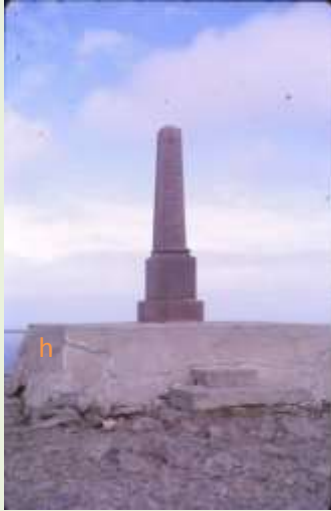
Monumento a Oscar II