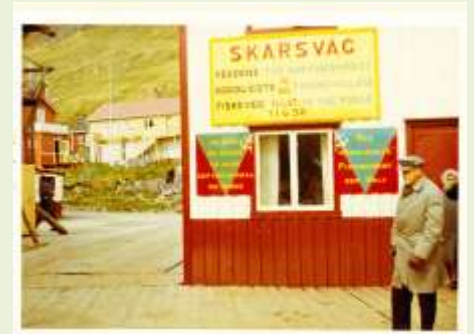
Llegada a Cabo Norte

El cabo norte está rodeado de alambrada debido al fuerte viento que hace. Regresamos al barco, retrocedimos rumbo a Bergen, y en un autocar recorrimos tierras de lapones viendo varios rebaños de renos.